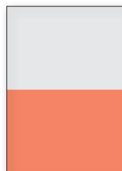
1/2 Seite quer 210 x 145 mm